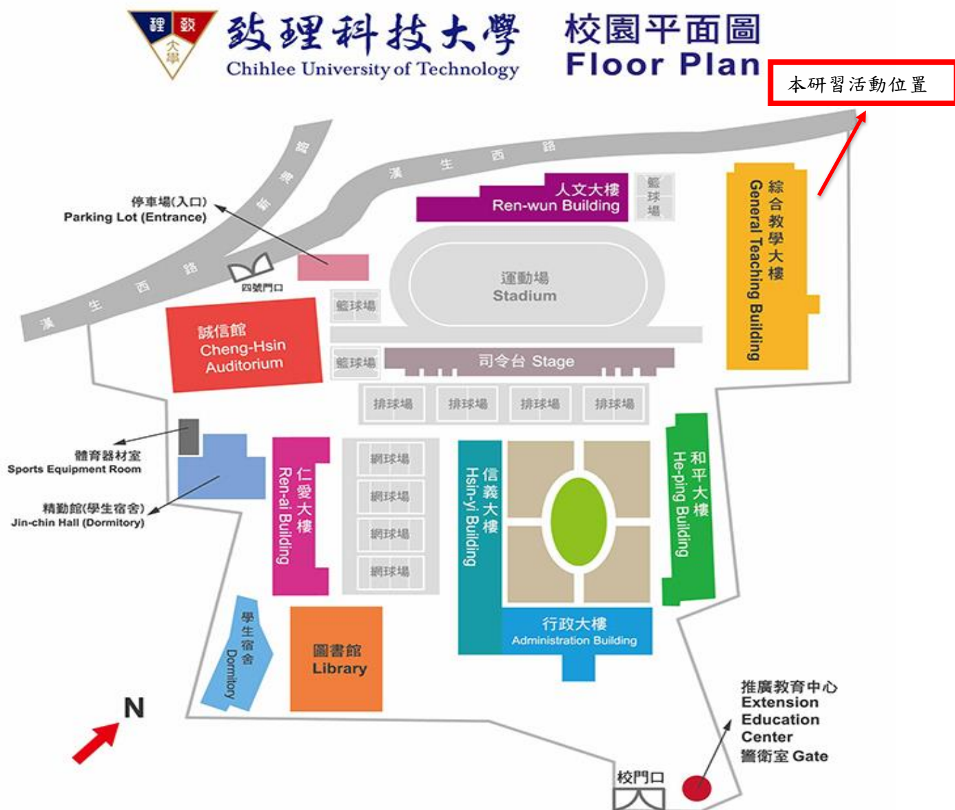
致理科技大學校園平面圖

2.經高速公路國道三號（北二高）中和交流道下，往板橋方向出口，接 64 號快速道路（西向），往萬板路出口方向下橋，直行民生路至迴轉道迴轉往文化路方向，右轉文化路直行，即可到達。